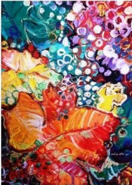
רנה בטיסו פיאדה

חברותינו שושי רימר וימימה לבן משתתפות בתערוכה קבוצתית ברמת גן. הנכח מוזמנות לבקר.